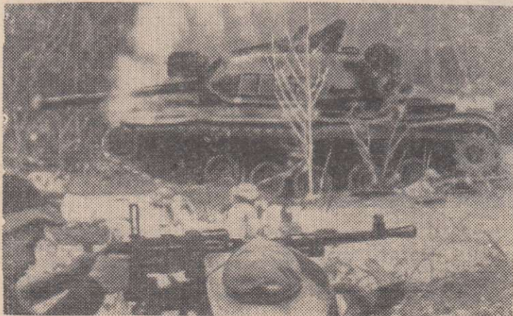
НА СНИМКЕ: патриоты ведут огонь из тяжелого пулемета. На заднем плане горит подбитый американский танк.

Ответа на вопрос не последовало. Президент Джонсон молча покинул церковь.