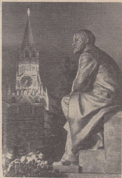
МОСКВА. Памятник В. И. Ленину в Кремле, торжественно открытый 2 ноября 1967 года.

А. КИРЮШИН. Член редколлегии журнала «Рабоче-крестьянский корреспондент».